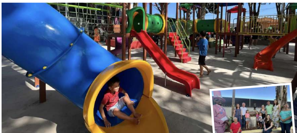
Inaugurado o Espaço Recreativo 'Elza Stecca Marolla'.

No domingo, dia 21 de abril, a Prefeitura Municipal de Dois Córregos celebrou a inauguração do Espaço Recreativo 'Elza Stecca Marolla', localizado na Rua 13 de Maio, ao lado do Centro de Saúde II. O evento, marcado para às 14h, reuniu moradores e autoridades locais em uma cerimônia especial.