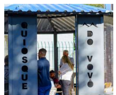
Localizado na Praça Francisco Simões, o Quiosque do Vovô

Essa iniciativa demonstra o cuidado e o carinho da comunidade para com seus idosos, proporcionando-lhes um espaço dedicado para socialização e diversão. Que o Quiosque do Vovô seja um local de en-