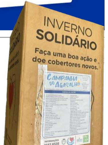
A campanha conta com 50 pontos de coleta espalhados estrategicamente por toda a cidade.

Portanto, junte-se à comunidade de Dois Córregos nesta nobre causa e ajude a tornar este inverno mais suportável