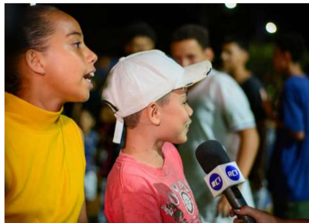
Jovem dá entrevista ao Portal RC1.