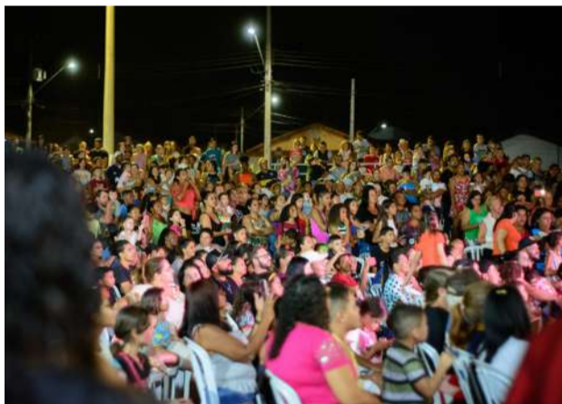
Mais de 2 mil pessoas participaram dessa incrível Ação Social.