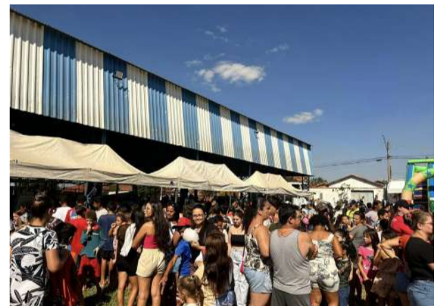
Diversas atividades sociais foram oferecidas para a população.