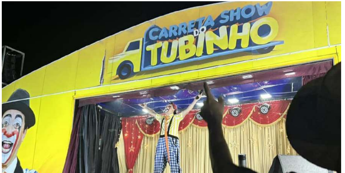
Carreta Show do Tubinho, o hilariante palhaço da Praça é Nossa.

As festividades não se encerraram durante o dia! Às 20h, a Carreta Show do Tubinho, com o hilariante palhaço da Praça é Nossa, apresentou um espetáculo imperdível! Mais de 2 mil pessoas participaram dessa incrível Ação Social.